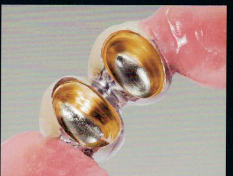
9 Die fertiggestellte Arbeit mit Gold glänzenden Außenteleskopen und perfekt eingestellter Friktion.

Galvanische Friktionserneuerungen erhalten Sie von: