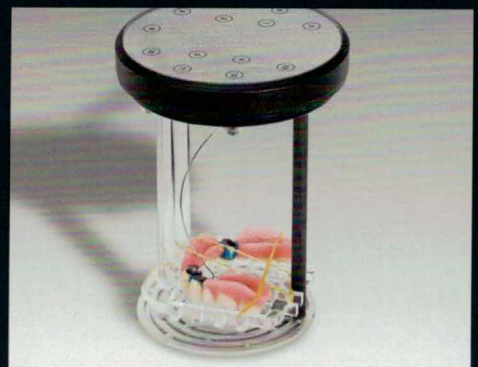
3 Die vorbereitete Arbeit wird mit einem Gummy an der Halteklammer befestigt und mit dem Galvanokopf kontaktiert.