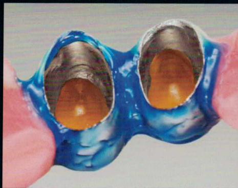
2 Abdecken aller nicht zu galvanisierenden Flächen mit Abdecklack bzw. Galvanowachs.