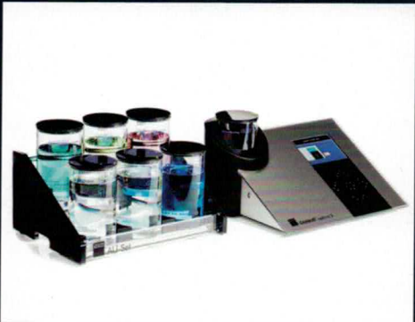
5 Alle Reinigungs-, Spül- und Galvanisiervorgänge werden im Galvanosystem GAMMAT® optimo2 durchgeführt.