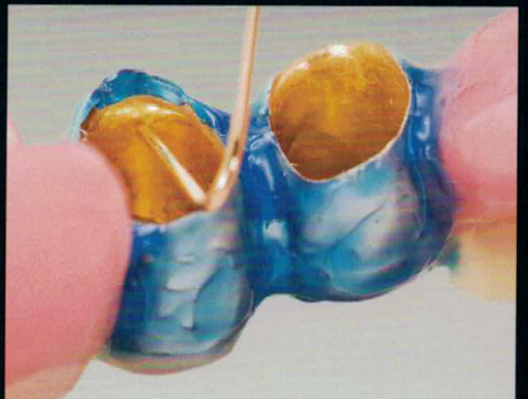
6 Nach der Friktionsvergoldung.