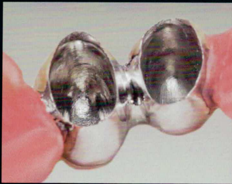
1 Die getragene Teleskoparbeit mit unzureichender Friktion wird gründlich gereinigt.