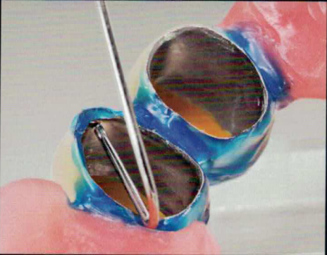
4 Die Teleskope werden mit einem Draht kontaktiert.